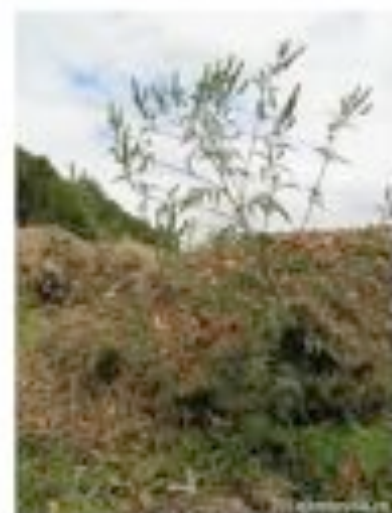
Ambroisie à feuille d'armoise dans du compost

communiquée à la FREDON pour que l'inventaire des sites contaminés et leur suivi soient optimaux.