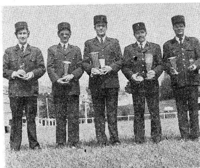
L'équipe des vétérans de Kerfourn, vainqueurs pendant trois années consécutives du challenge de l'inspection, gardera donc définitivement la coupe. A signaler que cette équipe a obtenu le meilleur temps des « mixtes ».