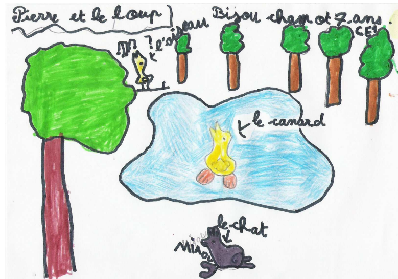
Dessin réalisé à la suite du spectacle.

Le dernier jour d'école, nous avons célébré Pâques avant l'heure. Sur le thème du pardon, chaque enfant a rédigé. Une colombe réalisée en classe véhiculera ce message de Paix.