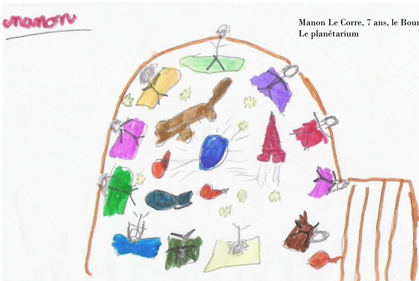
Manon Le Corre, 7 ans, le Bourg. Le planétarium

France Telecom nous informe : les lignes non éligibles à l'ADSL peuvent avoir accès au haut débit grâce à la toute nouvelle solution par satellite de 2 mégabits à 34.90€/mois que commercialise leur filiale Nordnet. Cette offre appelée Pack Internet Satellite permet au groupe Orange d'atteindre une couverture Haut Débit de 100% sur le territoire. Pour plus d'information téléphone au numéro vert 0800 66 55 50 ou le site internet : www.nordnet.com