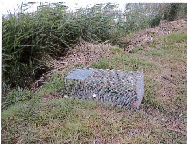
Cage-piège sélective pour ragondins et rats musqués

Votre commune participe à la limitation du développement des rongeurs aquatiques nuisibles (Ragondins/Rats Musqués) et donc à réduire fortement le risque de contraction de la Leptospirose