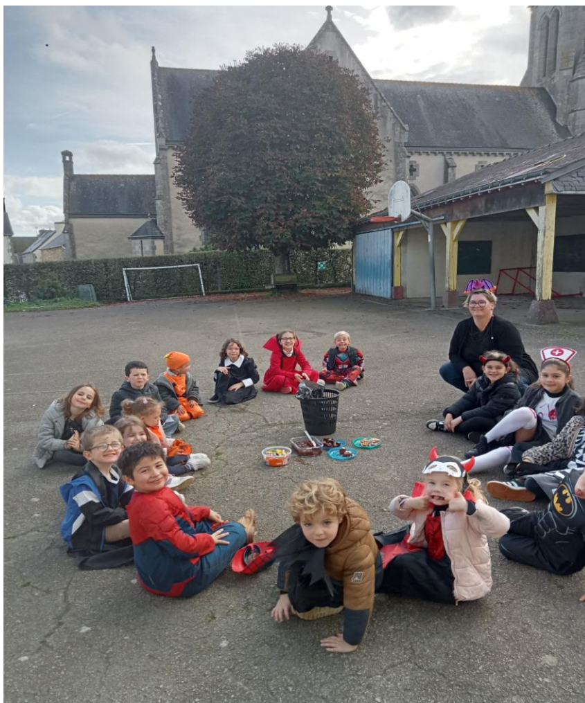
Fête d'Halloween 2024